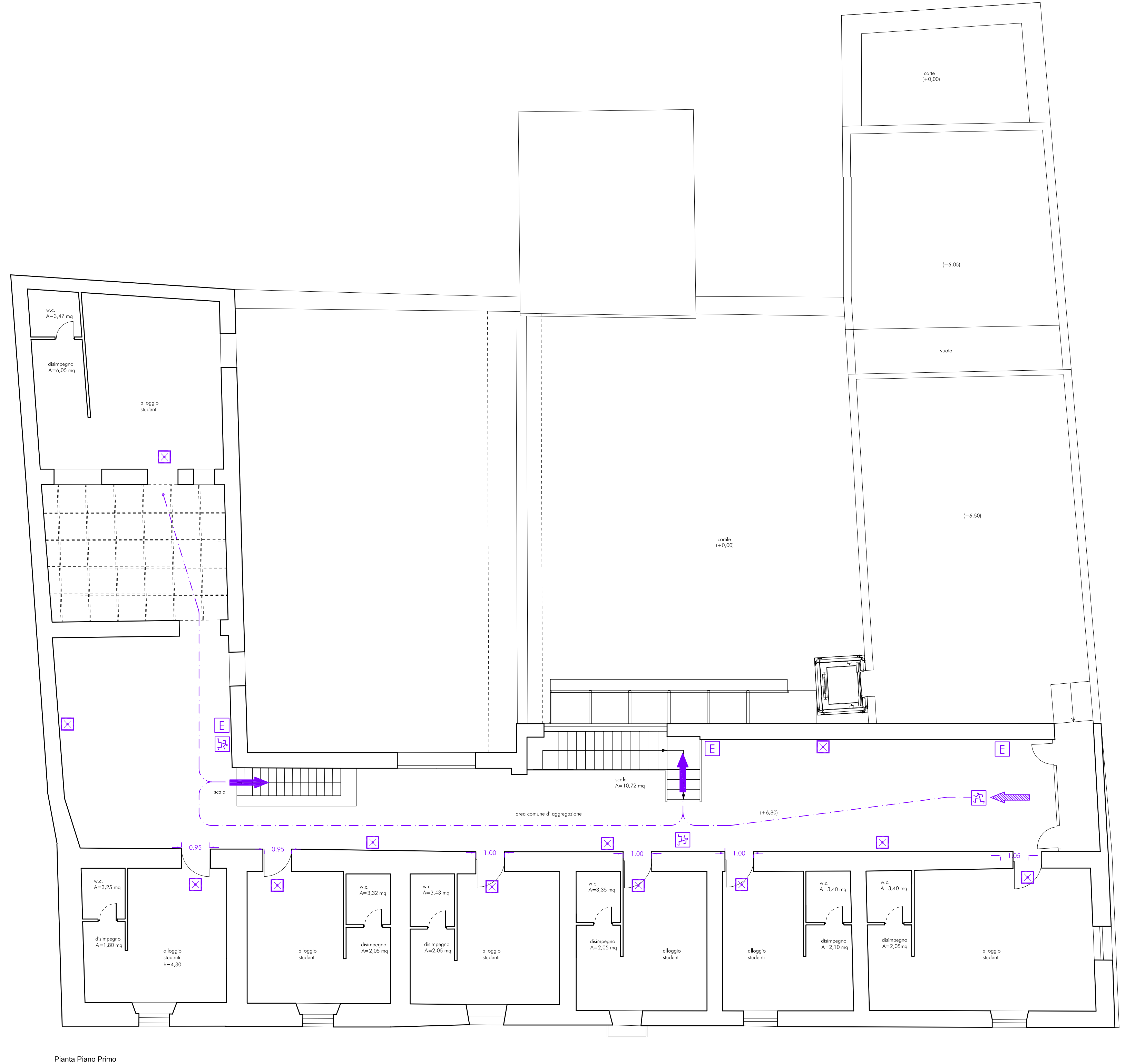
Pianta Piano Primo